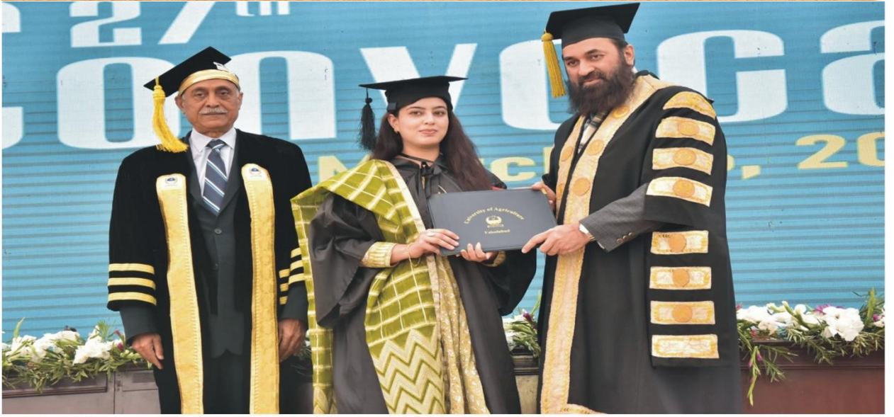
گورنر پنجاب / چانسلر محمد بلخ الرحمن، وائس چانسلر زرعی یونیورسٹی فیصل آباد پروفیسر ڈاکٹر اقرار احمد خاں کے ہمراہ 27 ویں کانووکیشن کے موقع پر اسناد و میڈل تقسیم کر رہے ہیں

Vol. No. 6322 http://web.uaf.edu.pk/CampusNews/ViewCampusNews Dated: 05-03-2024